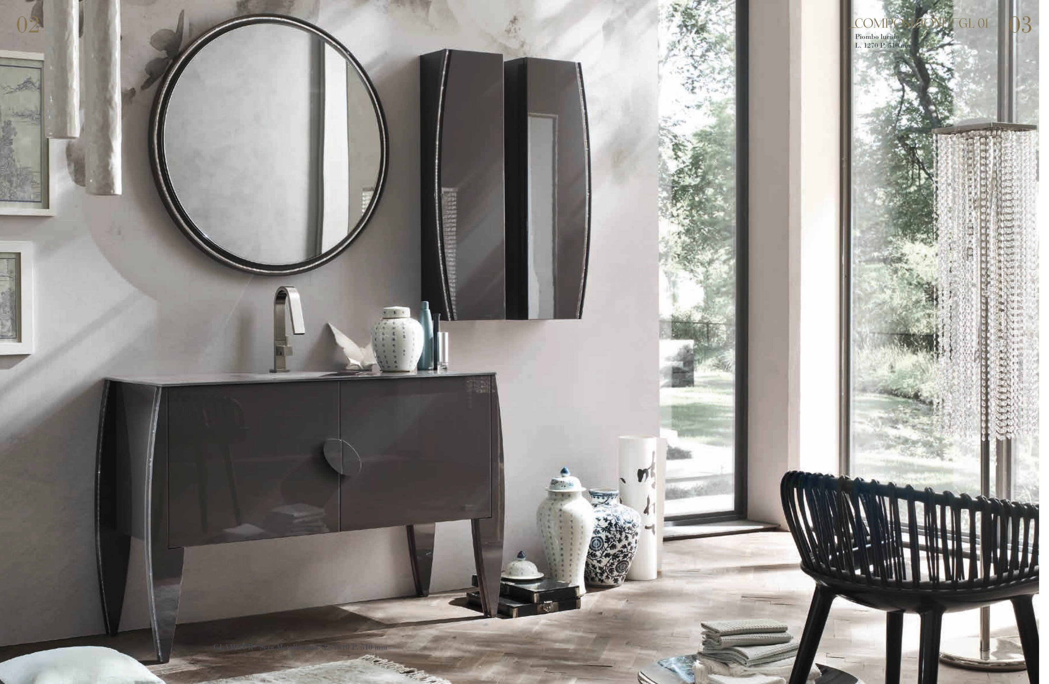
GLAMOUR® Serie Metallizzata P. 1270 P. 510 mm