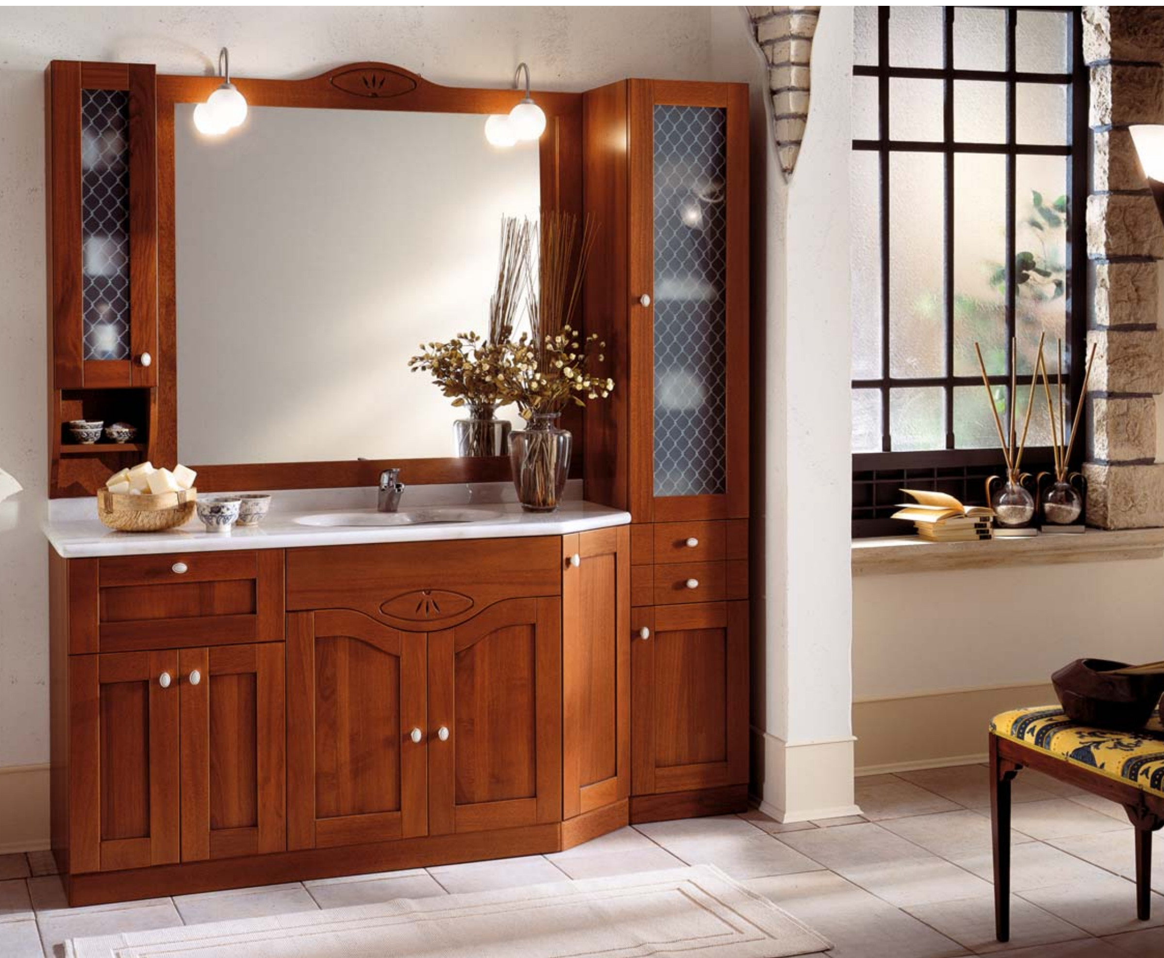
Composizione FI 13 L.1800 H.1970 P.350/500